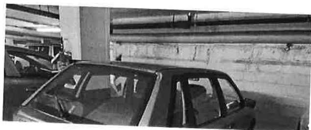
Citroen AX AX 5p 1.0 5V Ten