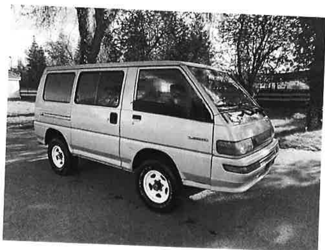
Mitsubishi L300 L 300 4WD 2,5 ltr. TD - AHK - aufgelastet 2,8 t