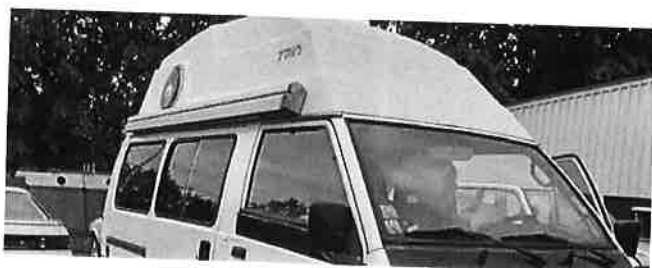
Mitsubishi L300 L 300 4WD