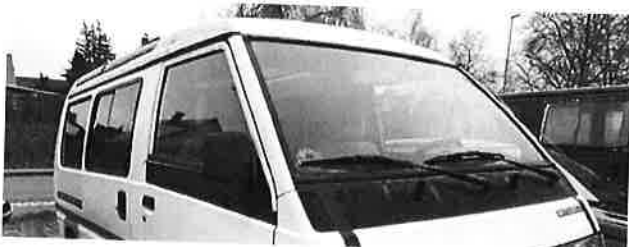
Mitsubishi L300 L 300 KAT Luxus