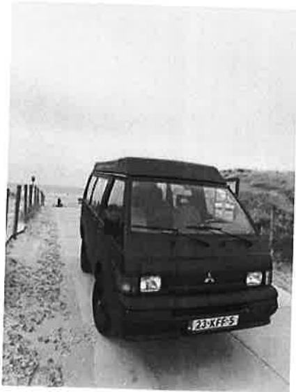
Mitsubishi L300 L 300 4x4 Camper