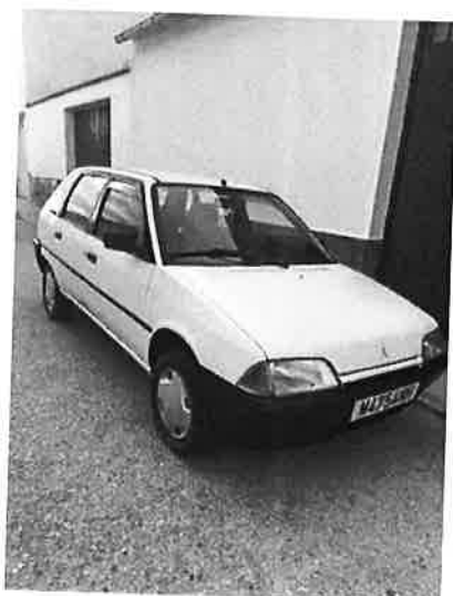
Citroen AX 11 RE