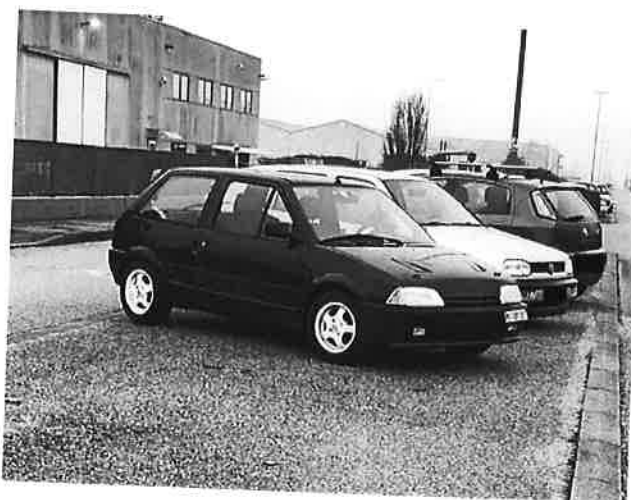
Citroen AX AX 3p 1.4 Gti cat.