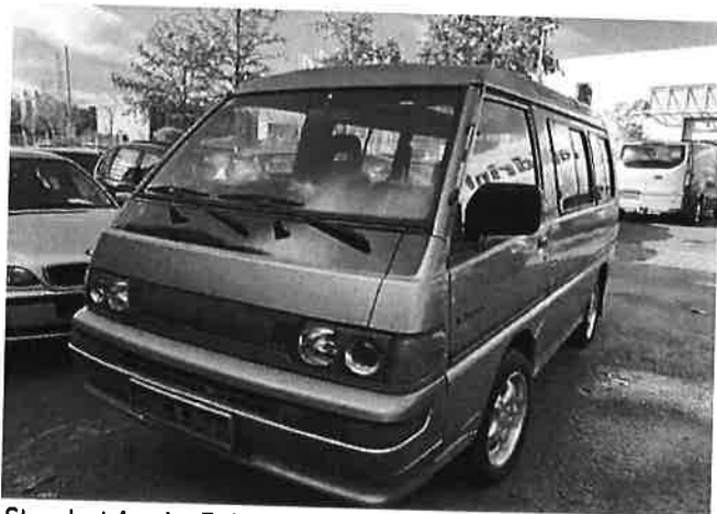
Mitsubishi L300 Luxus 2.4/Panodach/Alu/Anhängerkuppl./SH

Standort An der Fohlenweide 2-4a 67112 Mutterstadt