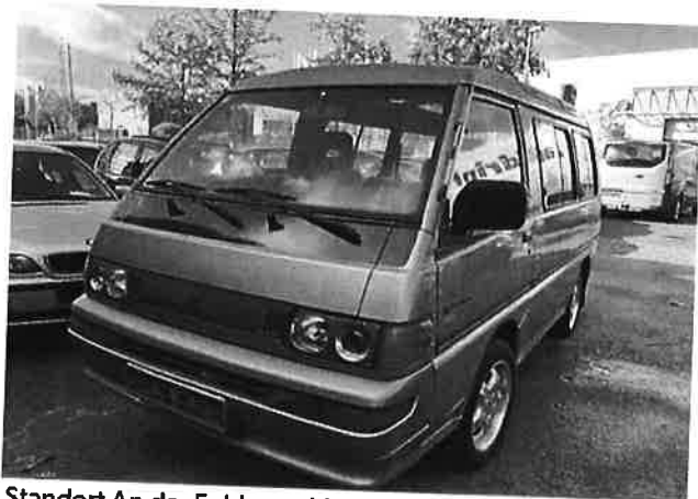
Mitsubishi L300 Luxus 2.4/Panodach/Alu/ Anhängerkuppl./SH

Standort An der Fohlenweide 2-4a 67112 Mutterstadt