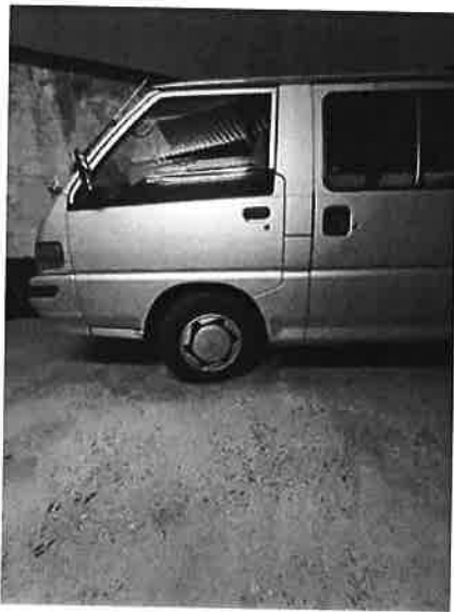
Mitsubishi L300 Benzin / LPG