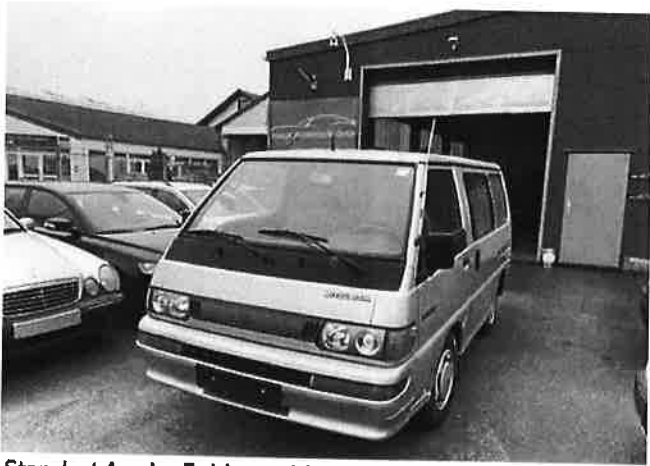
Mitsubishi L300 /1Hand/Klima

Standort An der Fohlenweide 2-4a 67112 Mutterstadt