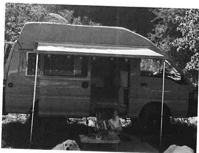
Mitsubishi L300 L300 2.5TD 4WD