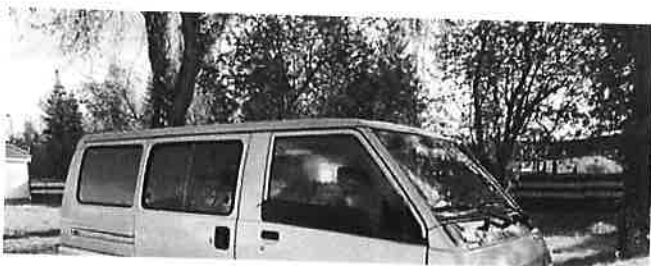
Mitsubishi L300 L 300 4WD 2,5 ltr. TD - AHK - aufgelastet 2,8 t