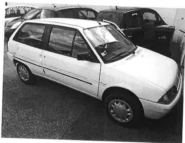
Citroen AX Belle 1992 1l tonic etat ct ok