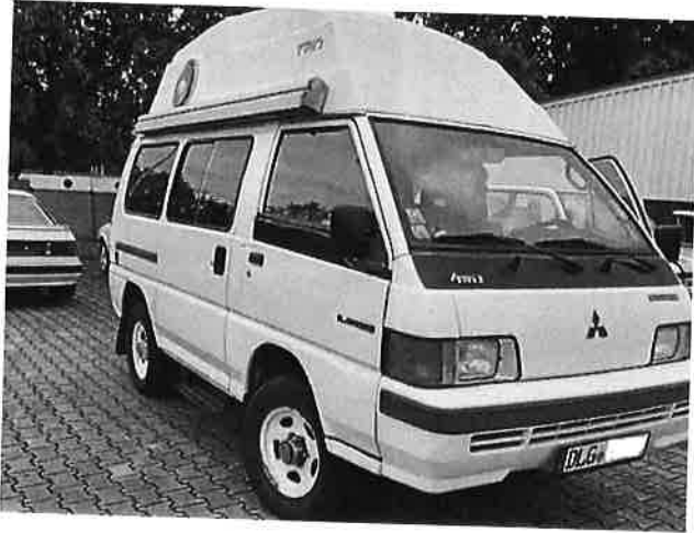
Mitsubishi L300 L 300 4WD