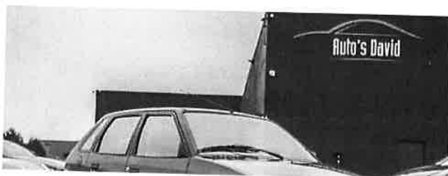
Citroen AX 1.1 Benzine / OLDTIMER / 5 DEUREN / 5 PLAATSEN