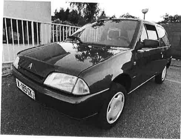
Citroen AX AX 1.0i Spot TBEG GAR. MEC.