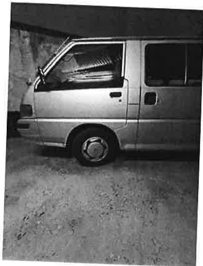
Mitsubishi L300 Benzin / LPG

Hauck Automobile GmbH DE-67657 Kaiserslautern